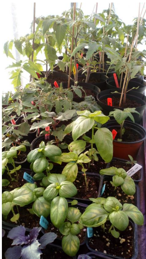
Två sorters basilika, storbladig och purpurfärgad. I bakgrunden tomater.

I Coronatider är det välgörande att ha en hobby. För min del handlar det om att odla växter, ätbart och det som är skönt för ögat.